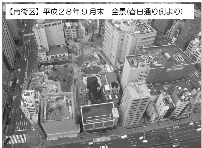
【南街区】平成28年9月末 全景(春日通り側より)