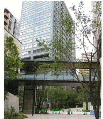
開通したガーデンブリッジ (上空通路)

これにより、雨天時等も傘をさすことなく南街区と北街区を行き来することができるようになりました。