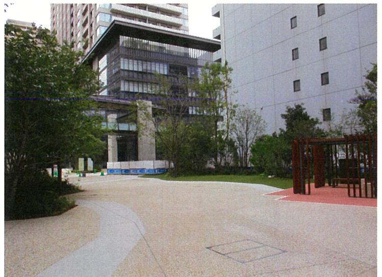
イベント広場 (名称募集中)